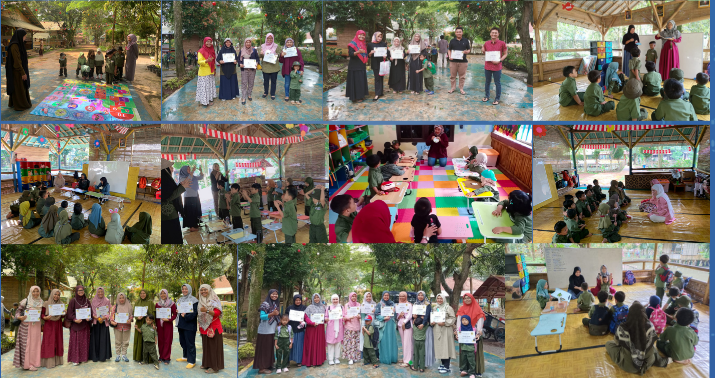
Kegiatan Program Orang Tua Mengajar yang dilaksanakan oleh KB-TK Kebun Tumbuh (3,14/2/2023)