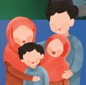
Kegiatan Parents Session : Selajar bersama untuk menjadi orang tua dan pengajar yang bijak (18/2/2023)