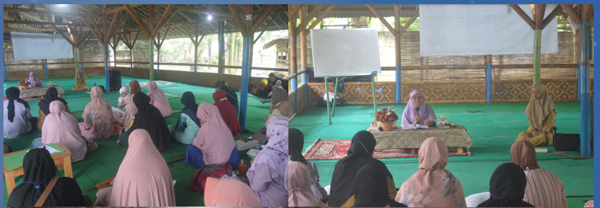
Kegiatan Kajian Orang Tua Siswa yang diselenggarakan oleh Komite Sekolah Alam Kebun Tumbuh (22/2/2023)