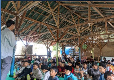
Kegiatan Peringatan Isra Mi'raj di Sekolah Alam Kebun Tumbuh (4/2/2023)

“Maha Suci Allah, yang telah memperjalankan hamba-Nya pada suatu malam dari Al Masjidil Haram ke Al Masjidil Aqsha yang telah Kami berkahi sekelilingnya agar Kami perlihatkan kepadanya sebagian dari tanda-tanda (kebesaran) Kami. Sesungguhnya Dia adalah Maha Mendengar lagi Maha Mengetahui.”