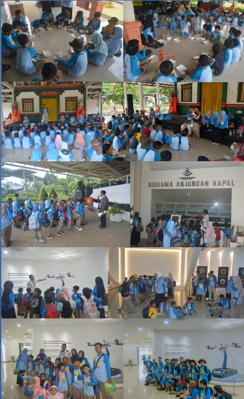
Outing Class SD Alam Kebun Tumbuh Kelas 1 dan 2 ke Taman Mini Indonesia Indah (16/2/2023)

Setelah mengunjungi anjungan DKI Jakarta, Yogyakarta dan Jawa Barat serta mendapatkan informasi tentang berbagai hal mengenai daerah tersebut meliputi wilayahnya, budayanya, pakaian adat, sejarah, makanan tradisional dan informasi lainnya. Para siswa menuju museum transportasi seluruh kelas 1 dan 2 berjalan dengan tertib membentuk barisan. Perjalanan menuju destinasi museum transportasi ini diiringi dengan gerimis yang tidak mengundang hujan (bukan lagu) akan tetapi mereka masih bersemangat.