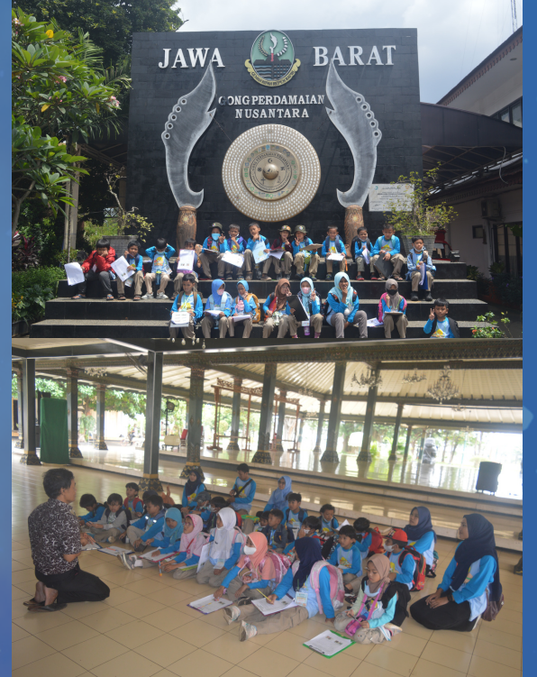
Outing Class SD Alam Kebun Tumbuh Kelas 1 dan 2 ke Taman Mini Indonesia Indah (16/2/2023)

Alhamdulillah hujan deras tidak berlangsung lama, setelah selesai makan siang hujan reda para siswa solat zuhur berjamaah lalu bersiap-siap untuk mengunjungi destinasi berikutnya yaitu museum transportasi.