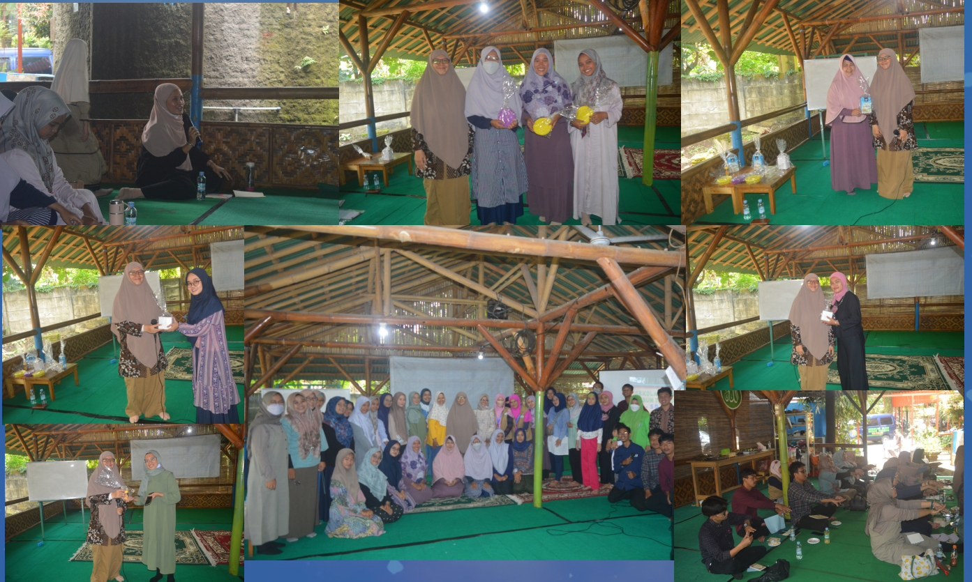
Kegiatan Parents Session : Orang tua pembelajar untuk masa depan anak yang lebih baik (18/2/2023)