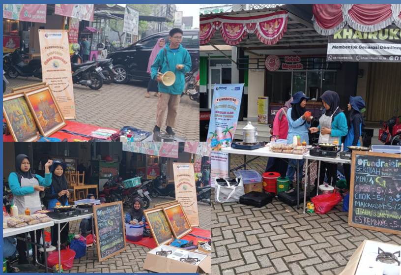
Kegiatan Fundraising Siswa SD kelas 5,6 dan SMP kelas 1 untuk Outing Class ke Ujung Genteng yang dilaksanakan di Perumahan Vila Rizki Ilhami 2 (8/2/2023)

Kegiatan Fundraising menjadi salah satu saran pembelajaran bagi anak-anak agar mereka memiliki keberanian untuk berbicara di tempat umum. Selain untuk mendapatkan dana mandiri untuk melaksanakan kegiatan Outing Class ke Ujung Genteng kegiatan ini juga dapat menumbuhkan kreativitas dalam berwirausaha.