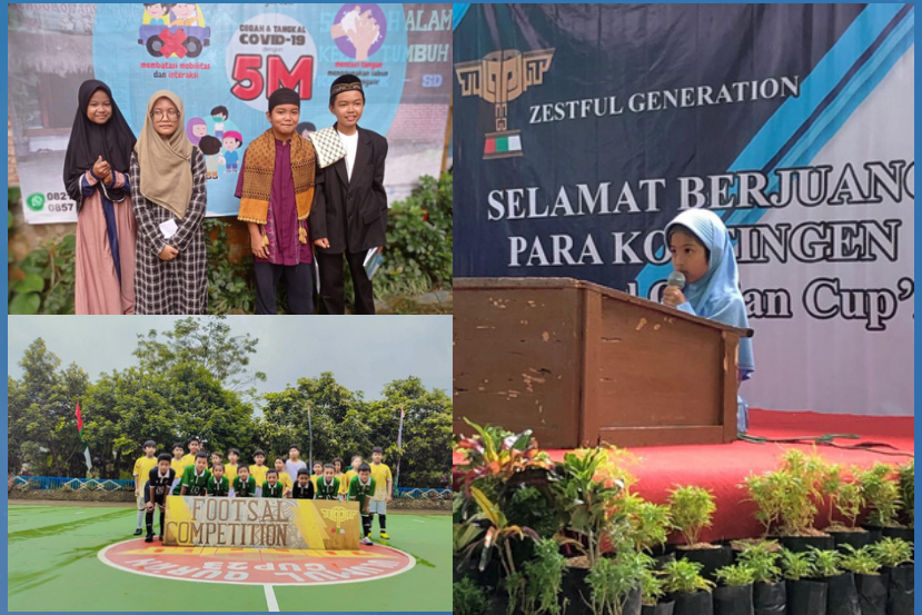
Kegiatan Pertandingan dan Perlombaan pada Ajang Ullumul Qur'an Cup 2023 yang diikuti oleh siswa siswi Sekolah Alam Kebun Tumbuh (1-4/2/2023)

Anak adalah anugerah dari Allah yang harus kita jaga dengan amanah dengan memberikan pendidikan terbaik. Bersekolah tidak hanya belajar menuntut ilmu akademik semata namun menumbuhkan karakter anak untuk berkompetisi juga sangat penting bagi kehidupan mereka di masa depannya. Sekolah Alam Kebun Tumbuh dengan 4 pilarnya menerapkan pendidikan berbasis life skill agar anak dapat memiliki jiwa uncut berkompetisi. Pada tanggal 1-4 Februari yang terdiri dari pertandingan Futsal, MHQ, Lomba pidato 3 bahasa. Beberapa siswa yang diutus terdiri dari siswa SD 3, SD 4, dan SD 6 serta SMP 1. Menang kalah bukanlah tujuan utama karena kemenangan adalah buah dari perjuangan dan latihan yang keras sebelumnya. Dalam ajang ini anak-anak diharapkan memiliki keberanian untuk berkompetisi dengan jiwa penuh sportivitas. (Taufik Akhirudin, S.Pi.)